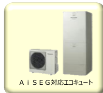
A I S E G 対応エコキュート